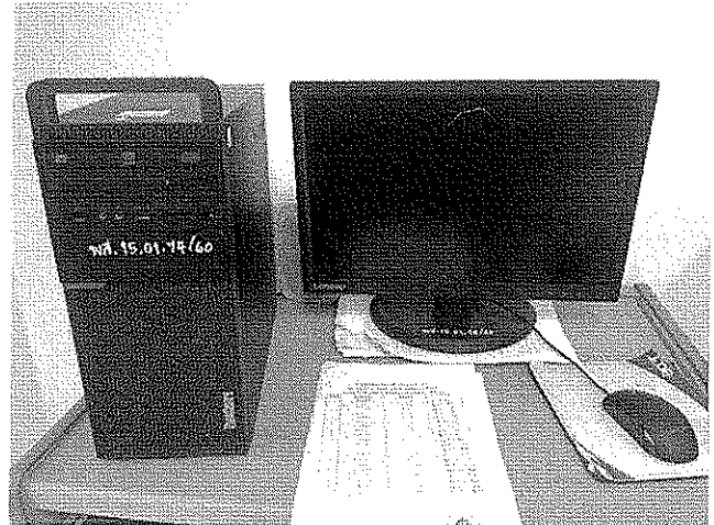
พส.15.01.74/60 ห้อง กอ.210