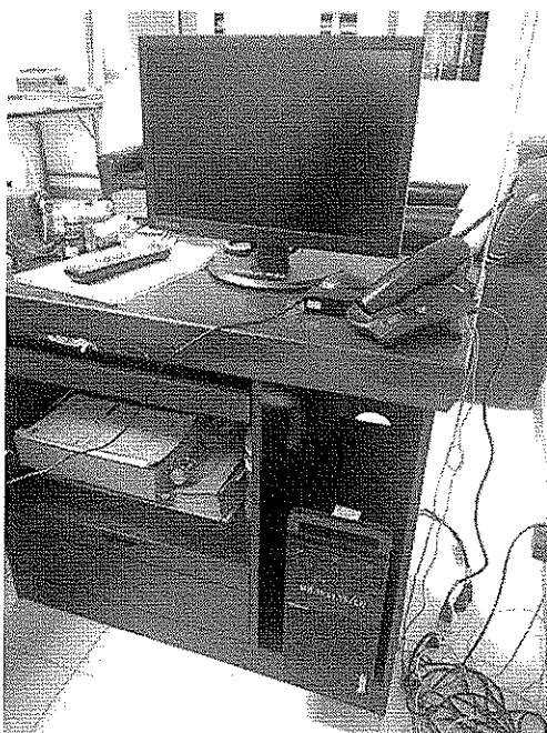
พส.15.01.75/60 ห้อง กอ.213